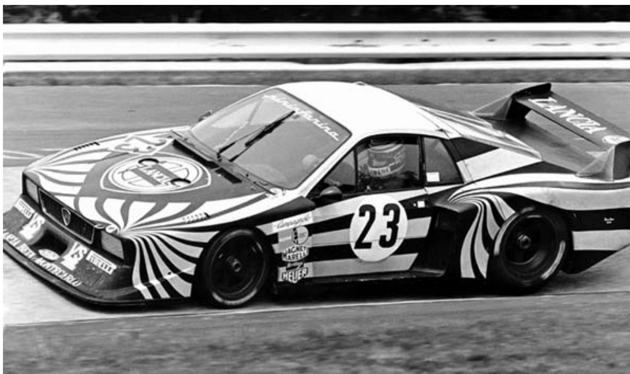
Il Mito del momento: la Lancia Beta Montecarlo di Riccardo Patrese, telaio n.1001 - 1979

Magazine indipendente pseudo storico, pseudo sportivo, pseudo sociologico, pseudo tecnico... pseudo insomma!