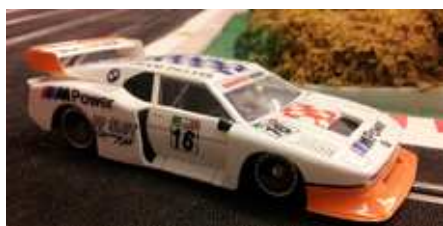
BMW M1 Cattivik