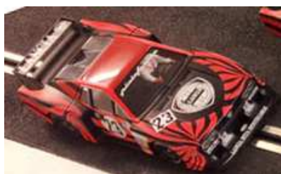
Lancia Beta Darioo