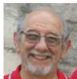
Ford Capri Renzosan